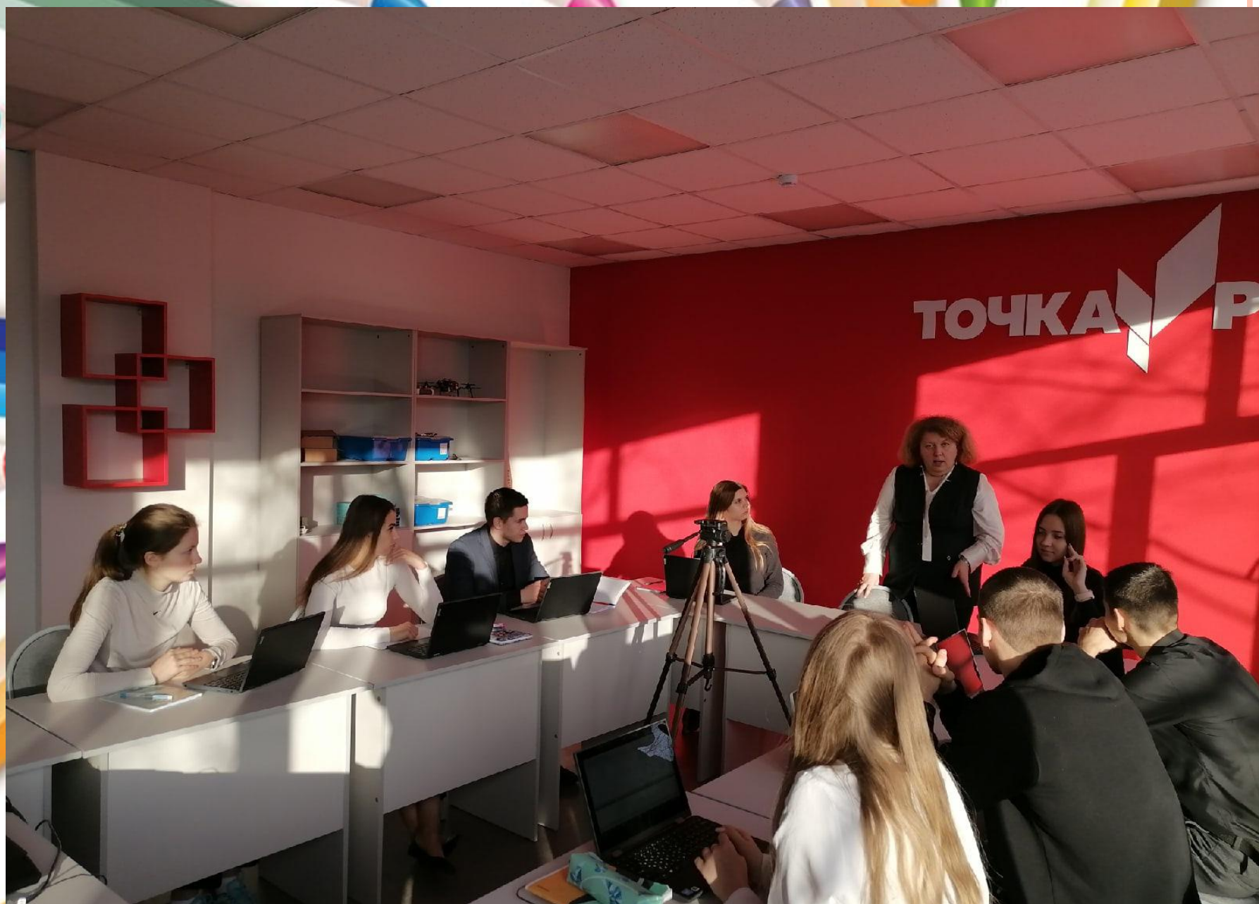
Занятия дополнительного образования по программе «Компьютерные науки»